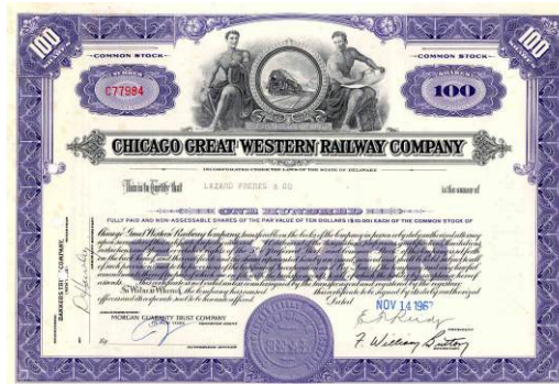
Fig. 1 : Action ordinaire de la Chicago Great Western Railway Company

En conséquence, le propriétaire d'une action est le propriétaire d'une fraction d'une entreprise. Les propriétaires d'actions sont appelés actionnaires . On rencontre aussi le terme de "parts sociales" pour les actions, et il y a une différence (en particulier en terme de droit) entre les deux. Dans le contexte de ce document, actions et parts sociales ne sont pas différenciées et sont considérées comme librement négociables : on peut les acheter et les vendre sur un marché financier sans restriction particulière.